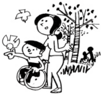
子ども用もあります

市内に居住し、病気やケガ等のために在宅で短期間車いすを必要とする方にご利用いただけます。※介護保険制度等で貸与可能な方は対象外 また、車いすのまま乗降可能な福祉車両の貸し出しもあります。お気軽にお問い合わせください。 問合せ／三島市社協 972-3221