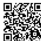
三島市協 ホームページ